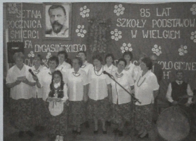
Występ zespołu Koła Gospodyń Wiejskich

Gminne Centrum Informacji w Gminie Zwoleń w perspektywie działać będzie w sieci w 4 innych gminach powiatu zwoleńskiego.