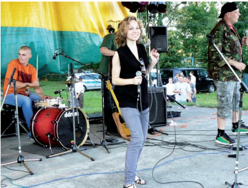
Zespół reggae ADHDub z Kielc

Do tej pory część artystyczną imprez uatrakcyjniały m.in. takie zespoły, jak: Iskierki (grupa dziecięca PSP Sycyna), SOBÓTKA z Czarnolasu, Chór SYCYNA , Tatra Roma (zespół cygański), Bayer Full , The Crunch (zespół rockowy), ADHDub (zespół reggae), Reproduktor (zespół blues-rockowy), Campi , Zdobywcy Pewnych Oskarów , Roxy , EYAA , Gipsy Girls , Lunatic , Samokhin Band , Juri Tokar , kabarety Pirania , Masztalscy .