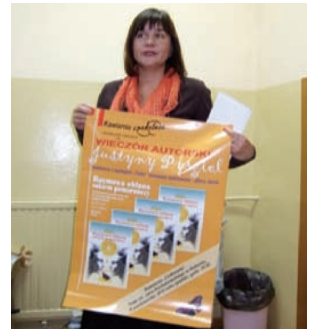
Autorka zapraszająca na spotkanie

Wieczory pełne artystycznych doznań zakończyły się toastem soku z pomarańczy oraz porcją czekoladowego tortu w kształcie serca, który uczestnicy wieczoru skosztowali przy akompaniamencie gitary i harmonijki ustnej.