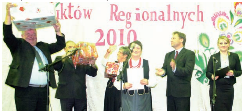
II miejsce w konkursie „Stoisko mile dla oczu” – Grabowianki