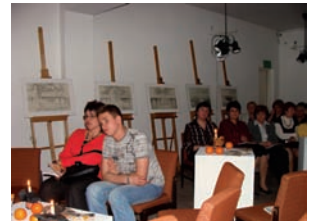
A sala była pełna