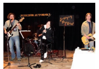
Zespół THE CRUNCH